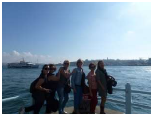
Met de TVI babes in Istanbul